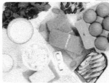
240 PACIENTES DO HOSPITAL DAS CLÍNICAS PARTICIPARAM DO ESTUDO

Para nenhum dos desfechos clínicos avaliados foi observada diferença significativa entre os grupos. Pereira ressalta que o ensaio foi desenhado para avaliar principalmente o impacto no tempo de internação e que, para mensurar o efeito sobre a mortalidade de forma adequada, seria necessário um número maior de voluntários.